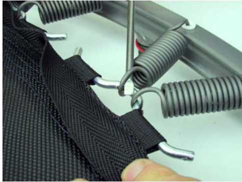
Ausbau - Dismounting – Démonter

Remplacer les ressorts du Sport comme montré avec un tourne-vis en utilisant l'effet de levier.